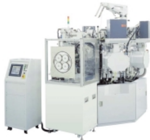
多層膜用スパッタリング装置