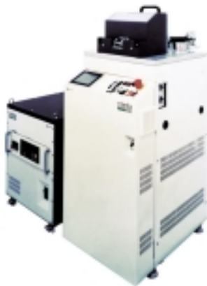
単層膜用スパッタリング装置

光ディスクの上部保護膜、下部保護膜、記録膜、アルミ反射層の形成には材料組成膜の均一性、歩留りなどが優れている スパッタリング装置 が使用されています。