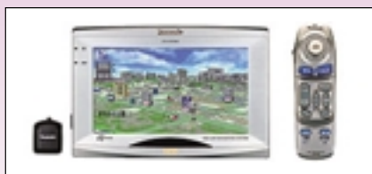
カーナビゲーション