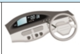
メーターパネルディスプレイ 有機 EL ディスプレイ

ミラー、ヘッドランプ、 フロントグリル、ウインドウ 超親水性のミラーコーティングは、従 来のミラーに比べて曇りにくい特長を 持ちます。