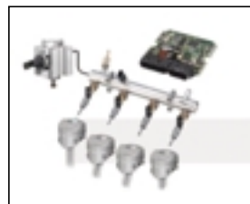
電子制御燃料噴射装置

LEDストップランプ フィラメントランプに比べ LEDは瞬時に発光、輝度も 明るいので安全性を高めて います。